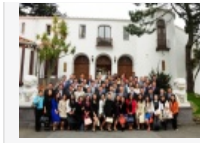
【组图】中国驻旧金山 总领事罗林泉...