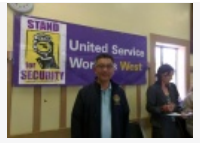
多位民选官员赴“公平 日薪”论坛听...